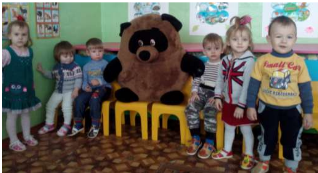
Чтение и обыгрывание стихотворения А.Барто «Мишка»