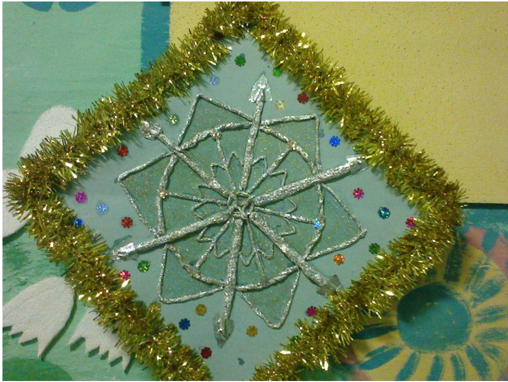
Снежинки своими руками.