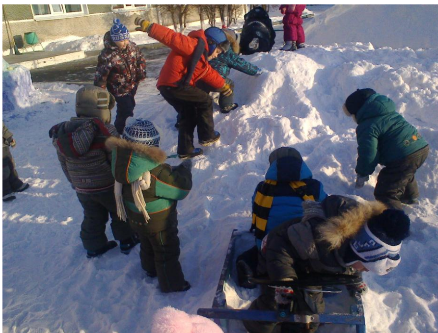
Вот теперь можно покорить снежные вершины!!!