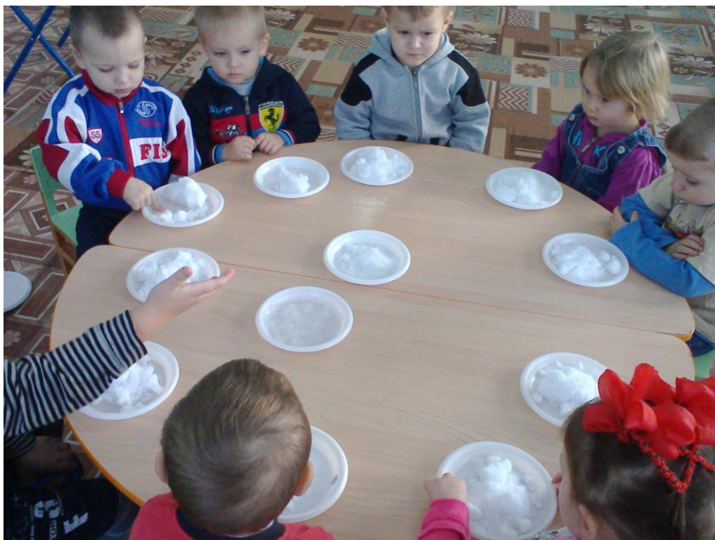
Игры-эксперименты со снегом