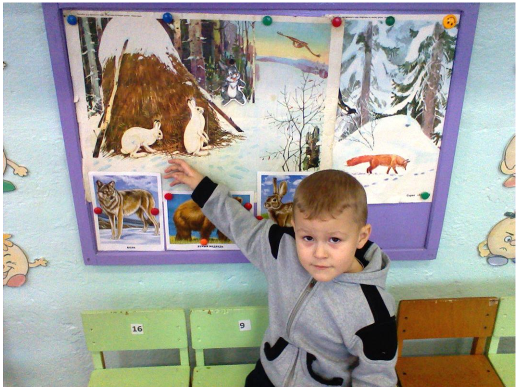
«Кто живет зимой в лесу»