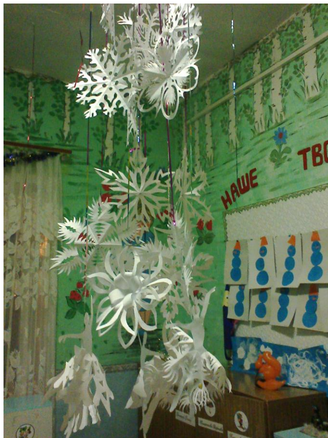
Рисуем веселого снеговика