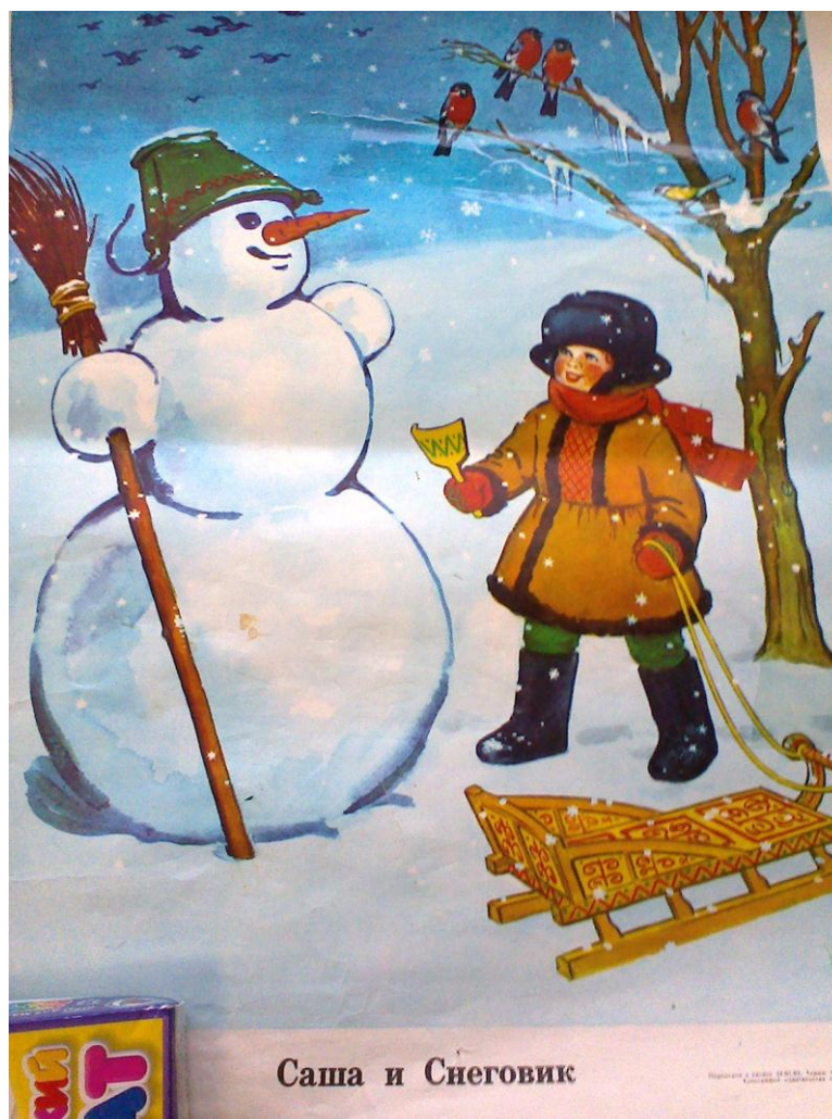
Саша и Снеговик